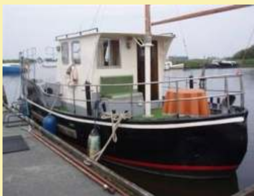
11m hossz*3,4m szélesség*1,2m merülés 120Lóer Mercedes motor komoly tengeri hajó, két kabin, öt ágy, nagyon kedvez ár 19 500 euró