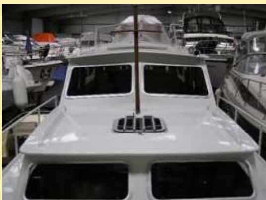
10,3m hossz*3,2m szélesség*0,9m merülés FORD motor, 120lóer , két kormányállás 29950 euró

Ha érdeklí valamelyik vagy valami hasonló esetleg valami teljesen más, kérem hívjon.