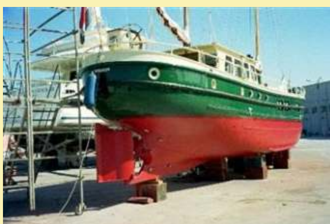
14,95m hossz*3,27m szélesség*1,35m merülés Volvo Penta motor, 105lóer , gyönyörű , tengerre folyóra egyaránt alkalmas, két árbocos vitorlás vagy motoros hajó rendkívül jó állapotban, komoly ára van, de nagyon megéri 62 500 euró

Ha érdeklí valamelyik vagy valami hasonló esetleg valami teljesen más, kérem hívjon.