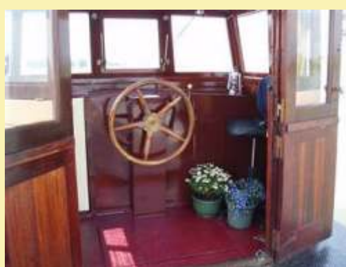
13m hossz*3m szélesség*0,8m merülés 80 lóer BMC motor), jó állapotban lévő kissé bumfordi, de tágas lakóhajó, ritka kedvez áron 15000 euró