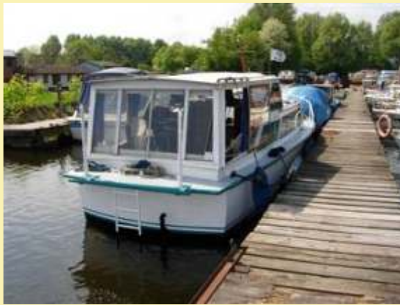
8,7m hossz*2,9m szélesség*0,8m merülés 42Lóer Mercedes motor 6500 euró (korábban 9000euró volt)