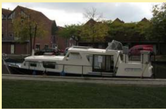
10m hossz*3,1m szélesség*0,8m merülés 55Lóer Peugeot motor két kormányállás, hátsó kabin 18 000 euró