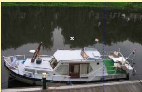
8,4m hossz*2,5m szélesség*1,1m merülés Volvo Penta motor, két kormányállás 8000 euró

Ha érdeklí valamelyik vagy valami hasonló esetleg valami teljesen más, kérem hívjon.