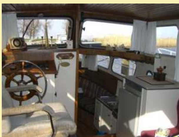
10m hossz*3,3m szélesség*0,9m merülés 45 lóer Yanmar motor (szinte új, 45üzemóra), 23000 euró