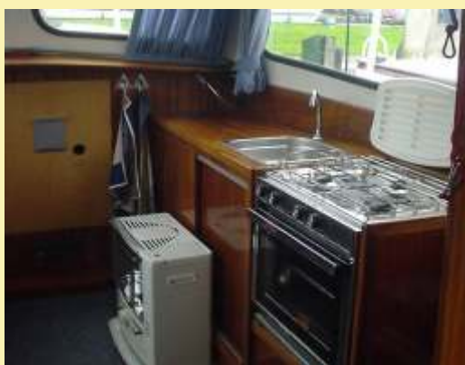
7,5m hossz*2,9m szélesség*0,7m merülés Yanmar motor, nagyon jó állapot 5000 euró